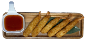
Crevetten im Teig